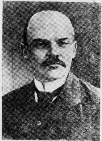
В. И. ЛЕНИН, Фото 1910 г.

Ленин возглавил борьбу с оппортунизмом и его разновидностью — центризмом в международном рабочем движении. Он отстаивал последовательную революционную линию на заседаниях Международного социалистического бюро (в котором Владимир Ильич с осени 1905 года представлял РСДРП), выступал против оппортунистов на Копенгагенском конгрессе II Интернационала (август 1910 г.).